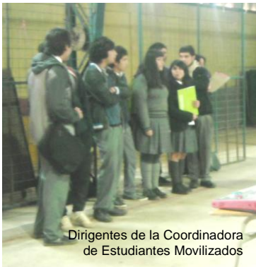
Dirigentes de la Coordinadora de Estudiantes Movilizados

Durante 37 días, desde el 22 de agosto hasta el 27 de septiembre, el liceo Mariano Latorre permaneció tomado por alumnos que realizaron esta acción como una manera de adhesión al movimiento nacional que ha reunido a estudiantes secundarios y universitarios en la demanda por educación pública, gratuita y de calidad para todos los chilenos.