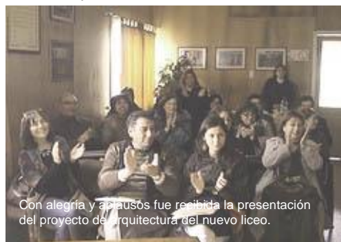
Con alegría y aplausos fue recibida la presentación del proyecto de arquitectura del nuevo liceo.

Otro tema tratado en esta mesa técnica fue el traslado y funcionamiento 2012 del Liceo Mariano Latorre, proceso que se ha coordinado directamente entre el Departamento de Educación Municipal y el liceo, a través de un Plan de Traslado, que incluye todos los pasos necesarios para finalizar el año escolar 2011 y habilitar las escuelas donde se trasladará el liceo. En este sentido, ya se han iniciado tareas como la actualización de inventarios, bodegaje y la postulación a proyectos por parte del DEM, para obtener los recursos que se requieren para las obras de reparación, habilitación y construcción en las dos escuelas que acogerán al liceo el próximo año.