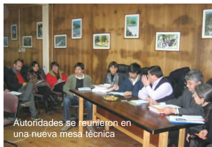
Autoridades se reunieron en una nueva mesa técnica

Con entusiasmo fue recibido por la comunidad escolar del Liceo Mariano Latorre el último avance del proyecto arquitectónico para la construcción del nuevo establecimiento, que fue presentado en la décima Mesa Técnica, de carácter ampliado donde se reúnen los distintos actores involucrados en el proceso de reconstrucción de este liceo. Esta reunión de mesa técnica ampliada, contó con la participación de